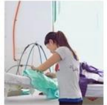
6:Pleating 7:Appliques 8:Hand-sewing 9:Hand-beading 10:Checking