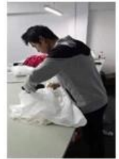
11:Taking photos 12:Packing 13:Shipping 14:Delivery