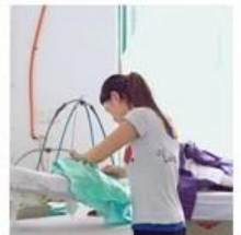
6:Pleating 7:Appliques 8:Hand-sewing 9:Hand-beading 10:Checking