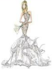
1:Designing 2:CAD Engraving 3:Tailoring 4:Sewing 5:Ironing