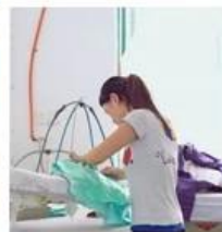
6:Pleating 7:Appliques 8:Hand-sewing 9:Hand-beading 10:Checking