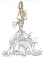
1:Designing 2:CAD Engraving 3:Tailoring 4:Sewing 5:Ironing